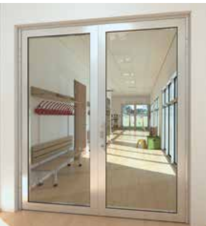
Klemmfreie Tür Anti-finger-trap door

The door and wall construction for multi-purpose applications. The series has been tested in accordance with European standards (EN 1364/1634) and German standards (DIN 4102) and meets the requirements of fire protection classes EI30 (T/F30) and EW30 (G30)