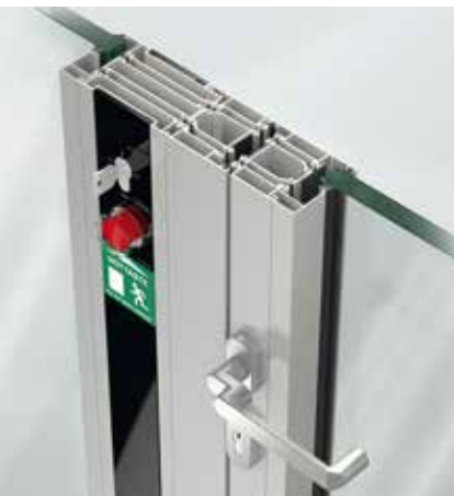
Schüco Door Control System (DCS) Schüco Door Control System (DCS)